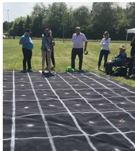
Pétanque : Soleil, bonne humeur... Il ne manquait plus que les cigales.