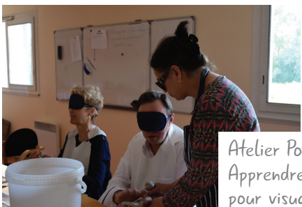
Atelier Poterie : Apprendre à toucher pour visualiser.