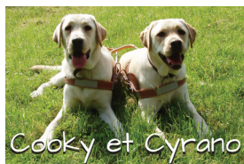
Cookie et Cyrano

Après des années de bons et loyaux services, les loulous partent en retraite.