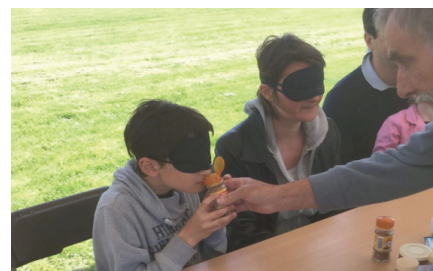
Atelier des sens : les yeux bandés, les sens sont déçuplés.