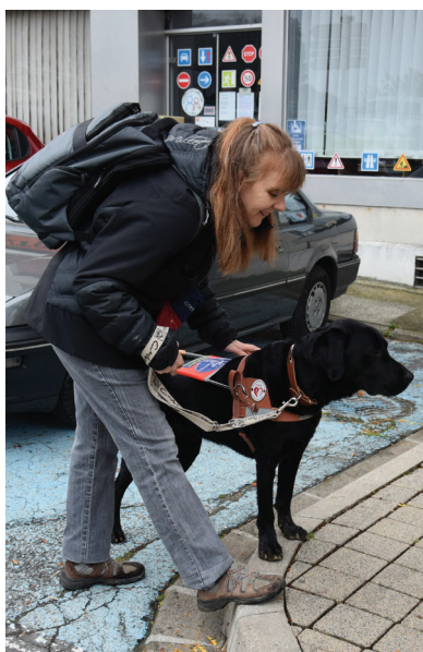
Madame Ovel & London

Joué les Tours (37) ÉLEVAGE PRIVÉ Éducateur : Valérie Remise : Blandine 3 au 13 juillet 2017